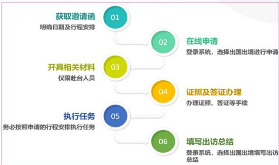
学生出境手续办理流程图

一、教学科研相关出国出境活动：经指导教师同意后，除短期参加国际会议（一周以内）外，联合培养、学习交流、科研实习等须携带邀请函、相关协议至学院教学科研办公室（三教 110 室）备案。公派出国项目申请流程及材料提交要求于当年另行通知。